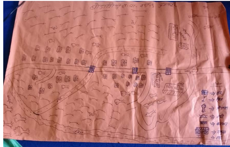
सामाजिक स्रोत तथा जोखिम नक्शाङ्कन जनकपुर टोल -९

जीविकोपार्जनका स्रोतहरू माथी के कस्ता जोखिमहरू छन् भनी पत्ता लगाउन जोखिम तथा प्रकोपहरूको नक्साङ्कन तयार गरिएको छ। यस छलफलबाट जोखिम तथा प्रकोपहरूको साथै स्थानिय समूदायको जीविकोपार्जनका स्रोतहरूको समेत पहिचान गरिएको थियो।