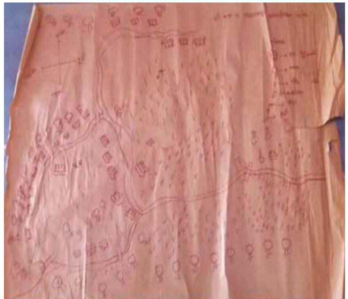
सामाजिक स्रोत तथा जोखिम नक्शाङ्कन आम्बोइया टोल -१०

जीविकोपार्जनका स्रोतहरू माथी के कस्ता जोखिमहरू छन् भनी पत्ता लगाउन जोखिम तथा प्रकोपहरूको नक्साङ्कन तयार गरिएको छ । यस छलफलबाट जोखिम तथा प्रकोपहरूको साथै स्थानीय समूदायको जीविकोपार्जनका स्रोतहरूको समेत पहिचान गरिएको थियो ।